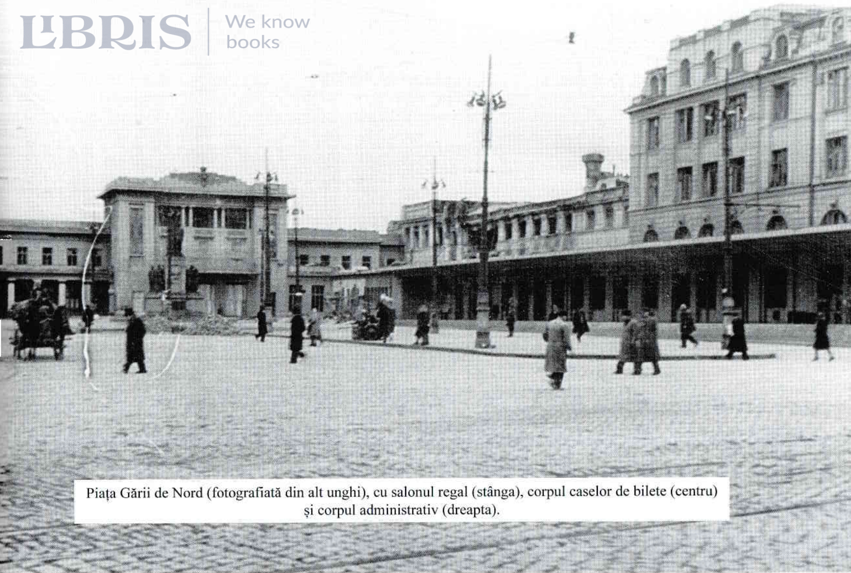
Piața Gării de Nord (fotografiată din alt unghi), cu salonul regal (stânga), corpul caselor de bilete (centru) și corpul administrativ (dreapta).