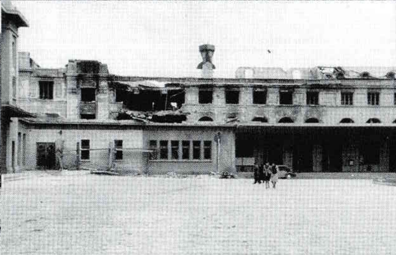
Clădirea Gării de Nord – corpul caselor de bilete și al poștei – după bombardamentul din 4 aprilie 1944.